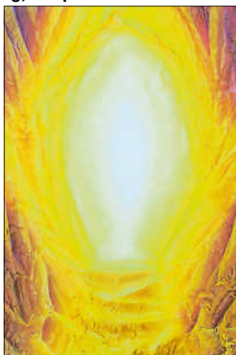
Grafik: M. Burchard

Wer nicht gut zu Fuß ist, kann auch gern zu Agapefeier und Abendbrot um 18 Uhr ins ev. Gemeindehaus kommen. Herzliche Einladung F.G. und Emmaus-Team